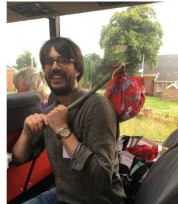
De medewerkers van de Heemtuin zorgden voor een creatieve lunch in de bus.... Prachtig gemaakt en lekker!

https://www.provinciegroningen.nl/loket/subsidies/natuur-en-landschap/groene-bewonersinitiatieven/