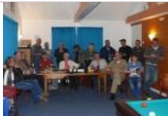
Foto- / filmmiddag, 13 uur. Jaarlijks, ± 70 pers. Oude foto's en film van Pieterburen. Historische Kring Eenrum.

Dicht Bie Diek, 19 uur. Wekelijks op donderdag, 14 leden. Biljartclub, met geregeld toernooiavonden.