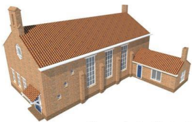
Presentatie Projectplan Dorpsavond 3 juli 2012