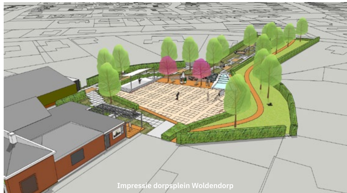
Impressie dorpsplein Woldendorp

Woldendorp is een wierdedorp in de gemeente Delfzijl met een kleine 1.000 inwoners. Naast de middeleeuwse Hervormde kerk kende het dorp tot 2017 ook een Gereformeerde kerk. Deze moest echter gesloopt worden vanwege