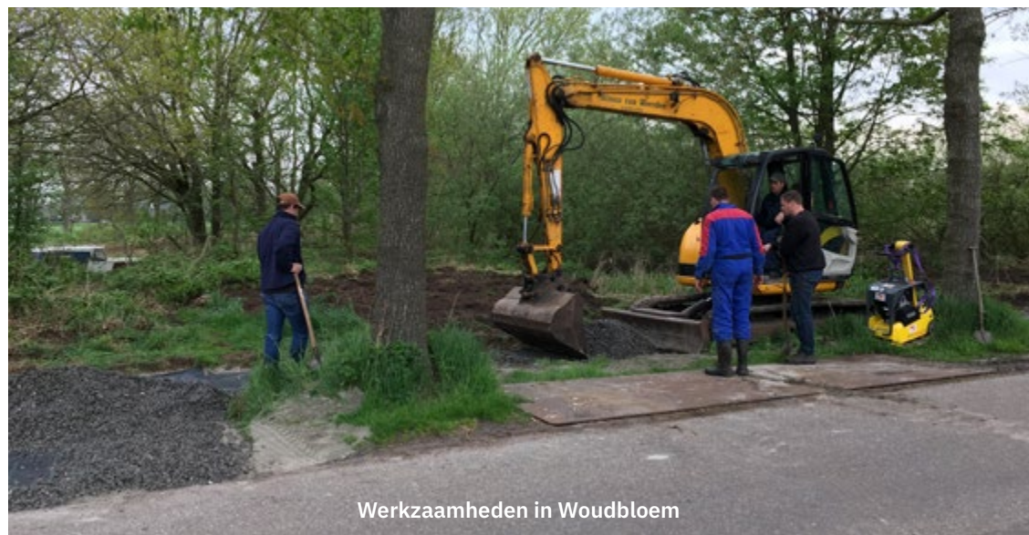
Werkzaamheden in Woudbloem

Woudbloem is een klein dorpje in de gemeente Midden-Groningen gelegen tussen Harkstede en Slochteren. Karakteristiek voor het dorp is de rij van