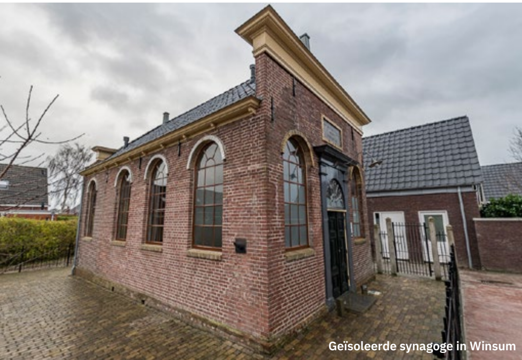
Geïsoleerde synagoge in Winsum