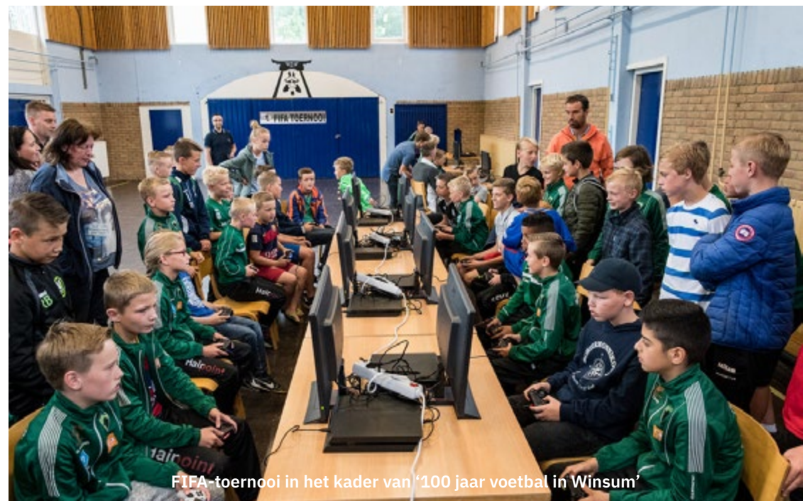
FIFA-toernooi in het kader van '100 jaar voetbal in Winsum'