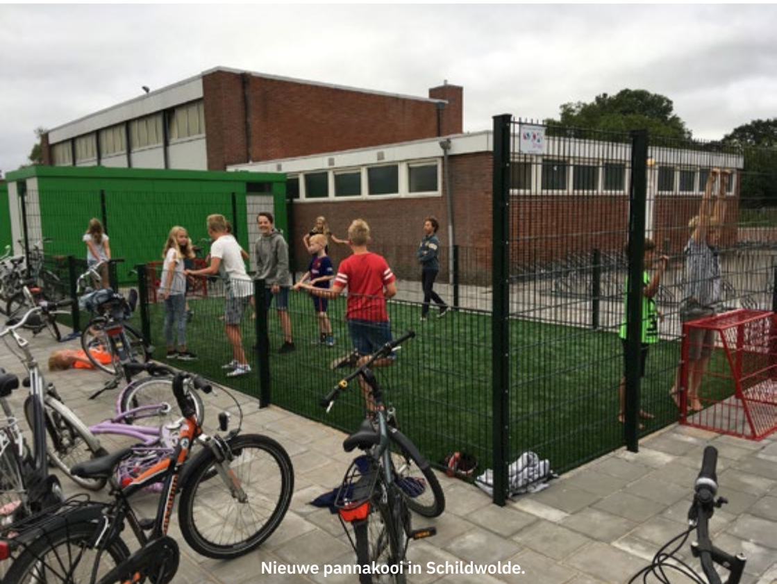
Nieuwe pannakooi in Schildwolde.