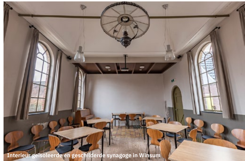
Interieur geïsoleerde en geschilderde synagoge in Winsum

De inbreng van NAM was soms wat dwingend. Het zou goed zijn om de commissieleden regelmatig te wisselen. Er zou bijvoorbeeld voor gekozen kunnen worden om iemand maximaal een jaar in de commissie zitting te laten nemen. Er moet altijd objectief naar een aanvraag worden gekeken, soms is dat lastig vanwege persoonlijke betrokkenheid. Dan is het wellicht beter om over die betreffende aanvraag niet mee te beoordelen.