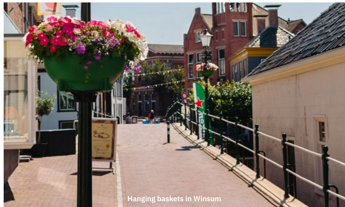
Hanging baskets in Winsum

Winsum was tot voor kort de hoofdplaats van de gelijknamige gemeente maar ligt nu in de gemeente Hogeland. Het historische centrum kent