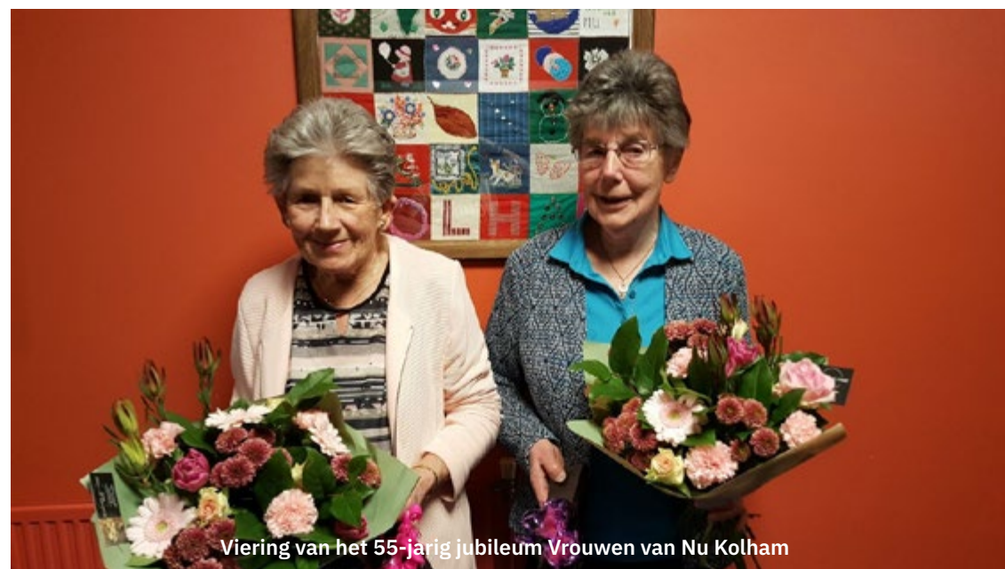
Viering van het 55-jarig jubileum Vrouwen van Nu Kolham