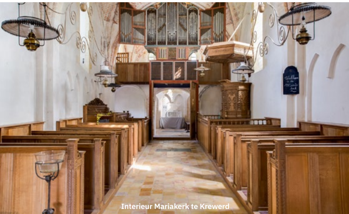
Interieur Mariakerk te Krewerd

Om de effecten van de regeling inzichtelijk te maken hebben we een aantal initiatieven uitgelicht. Interviews met de aanvragers zijn hieronder te lezen. Daarnaast geven we hier inzicht in de verdeling van het geld over de verschillende gemeenten en categorieën.