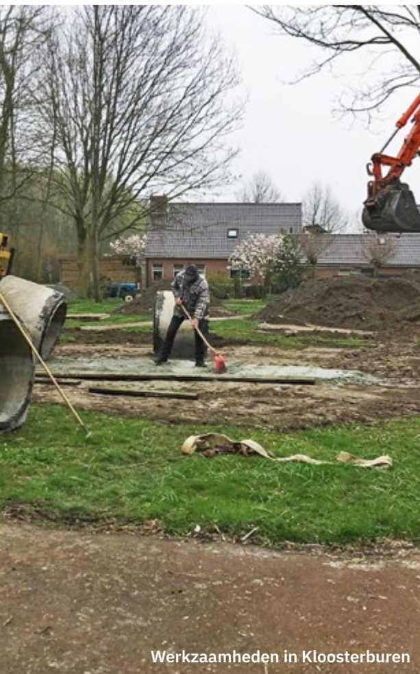
Werkzaamheden in Kloosterburen